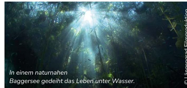
In einem naturnahen Baggersee gedeiht das Leben unter Wasser.

Das Projekt Free Flow der Stiftung Living Rivers wird gefördert durch das Umweltbundesamt und das Bundesministerium für Umwelt, Naturschutz, nukleare Sicherheit und Verbraucherschutz. Die Mittelbereitstellung erfolgt auf Beschluss des Deutschen Bundestages. Die Verantwortung für den Inhalt dieser Veröffentlichung liegt bei den Autorinnen und Autoren.